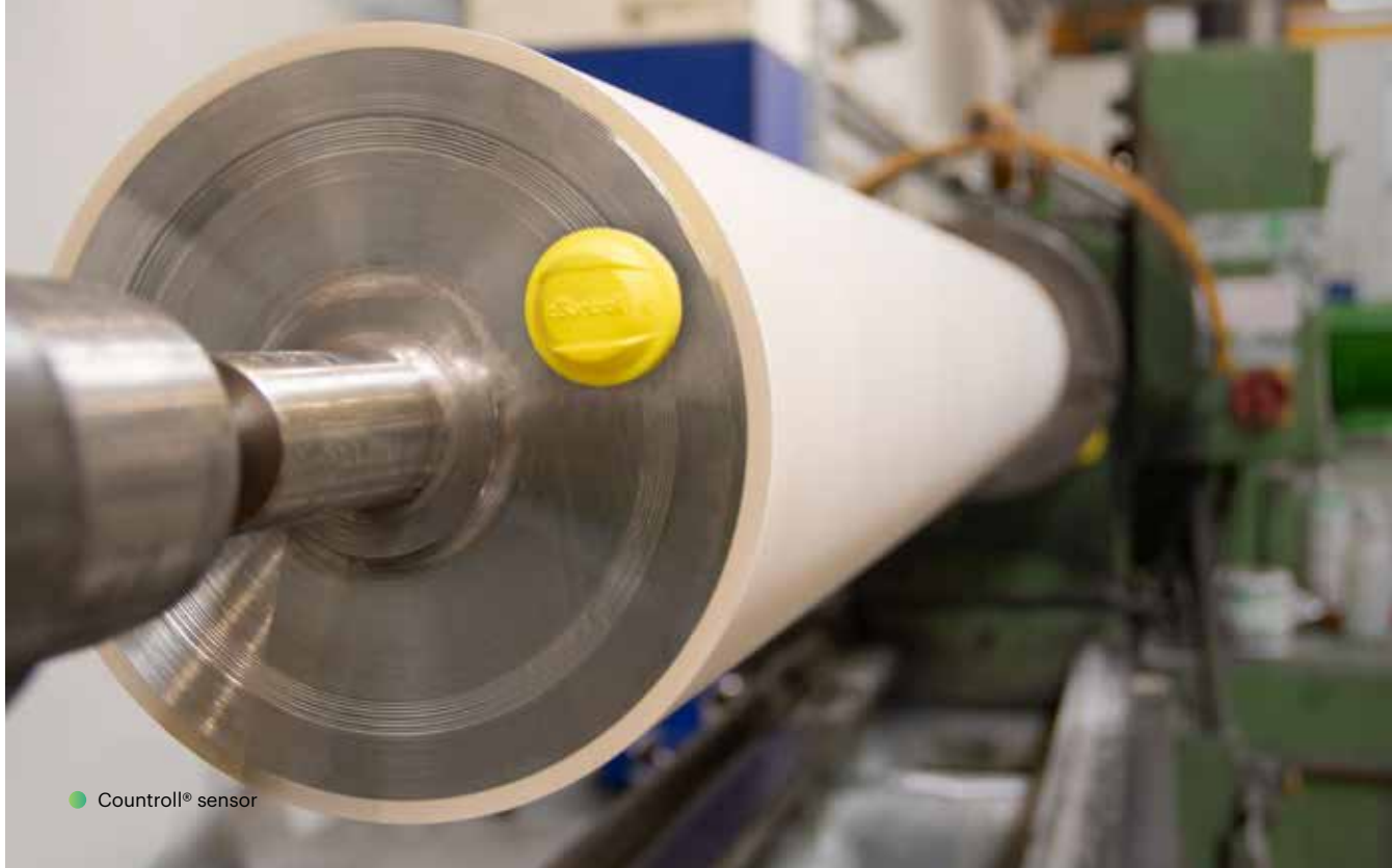
● Countroll® sensor