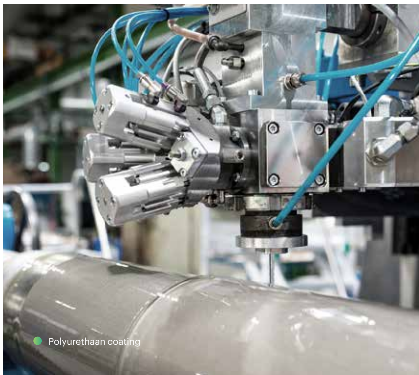
● Polyurethaan coating

Polyurethaan heeft over het algemeen een hogere slijtvastheid, snij- en scheurweerstand dan rubber en ook een beter draagvermogen, vooral bij hoge hardheden. We bieden een uitgebreid MOCA-vrij assortiment technische polyurethanen aan, waaronder coatings met hoge temperatuurbestendigheid, zuurweerstand en verbeterde dynamische eigenschappen. Dankzij ons state-of-the-art machinepark kunnen wij polyurethaancoatings produceren met de allerbeste eigenschappen.