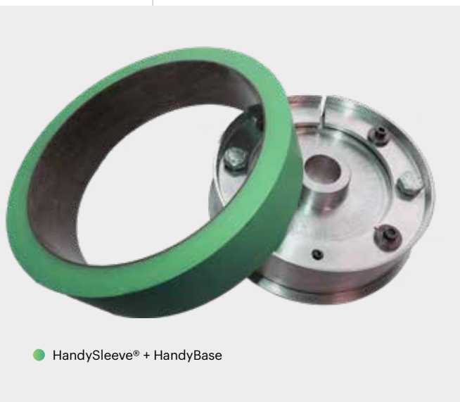
● HandySleeve® + HandyBase

Om te voldoen aan de behoeften, eisen en toenemende productie van deze industrie, ontwikkelde Hannecard HandyCoat®, een revolutionair coatingsysteem voor drankblikjes. Ons unieke HandyCoat® systeem biedt een extreem snelle en efficiënte manier om coatings aan te brengen op aluminium blikjes, wat een aanzienlijke tijd- en kostenbesparing oplevert.