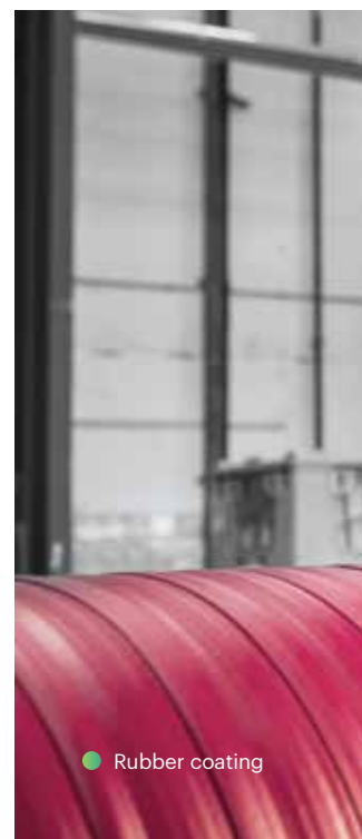
● Rubber coating