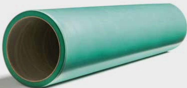
● Composiet & rubber sleeves