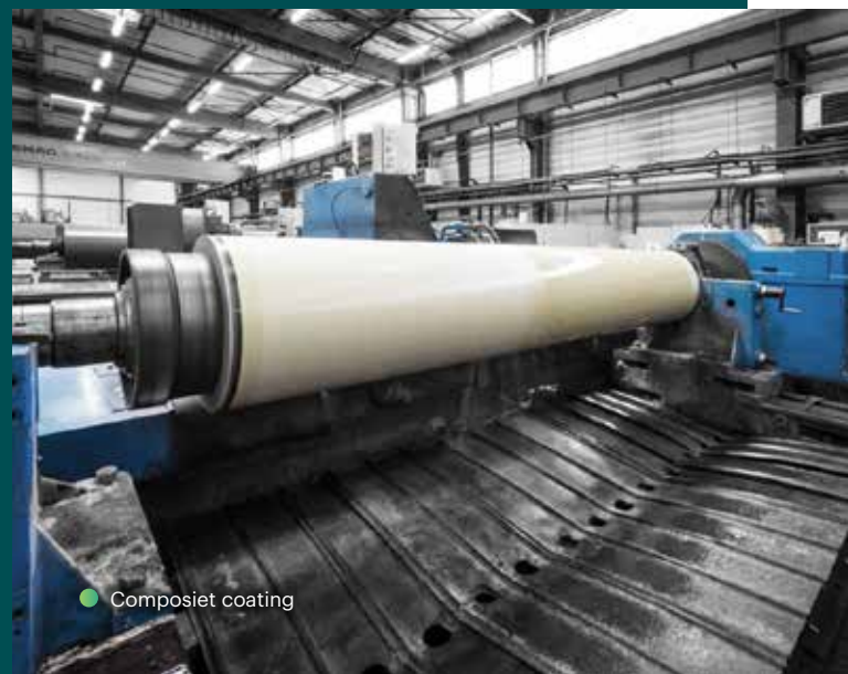
● Composiet coating