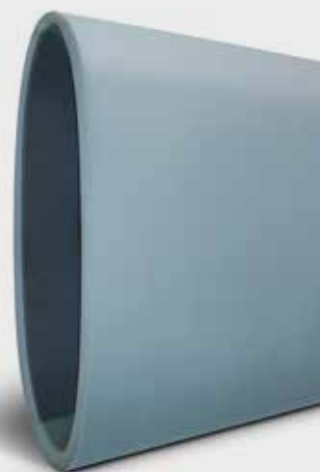
● Rubber banden voor Sanfor machines