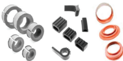
Bagues d'isolations / Profils d'étanchéité / Manchons et gaines