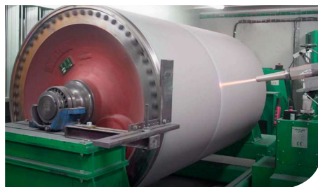
HP HVOF Thermal Spray