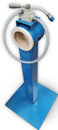
Station de montage